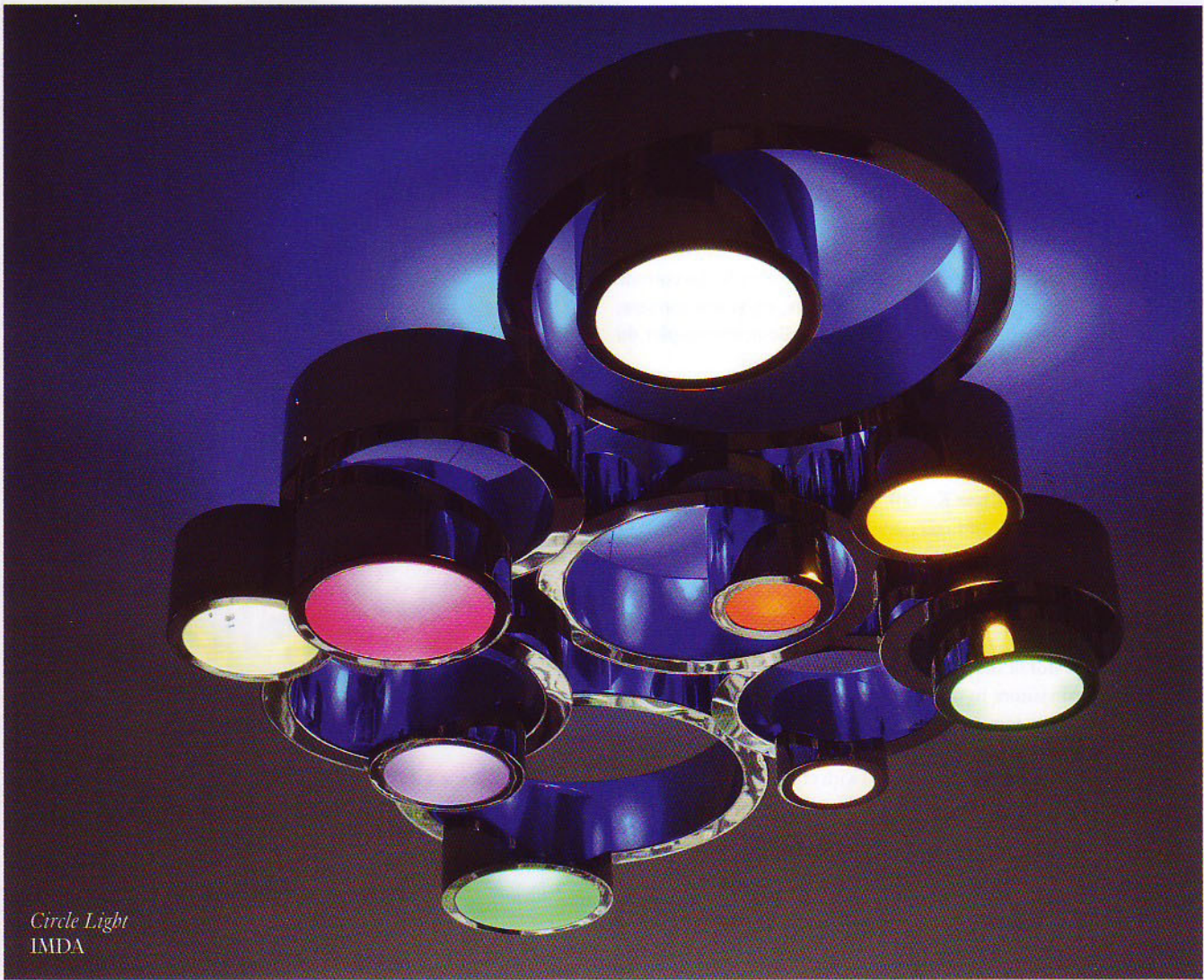
Circle Light IMDA