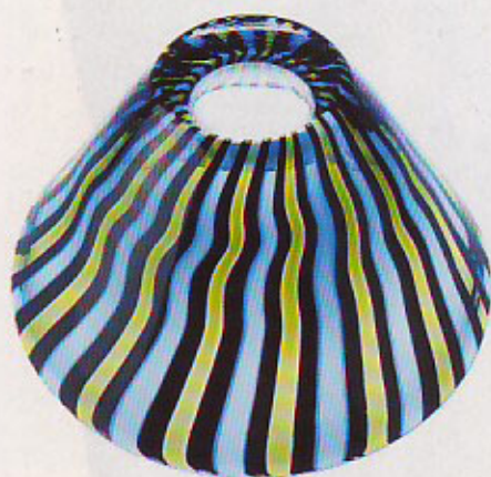
"Abyss 3 (ø cm 38,5 - h cm 21)