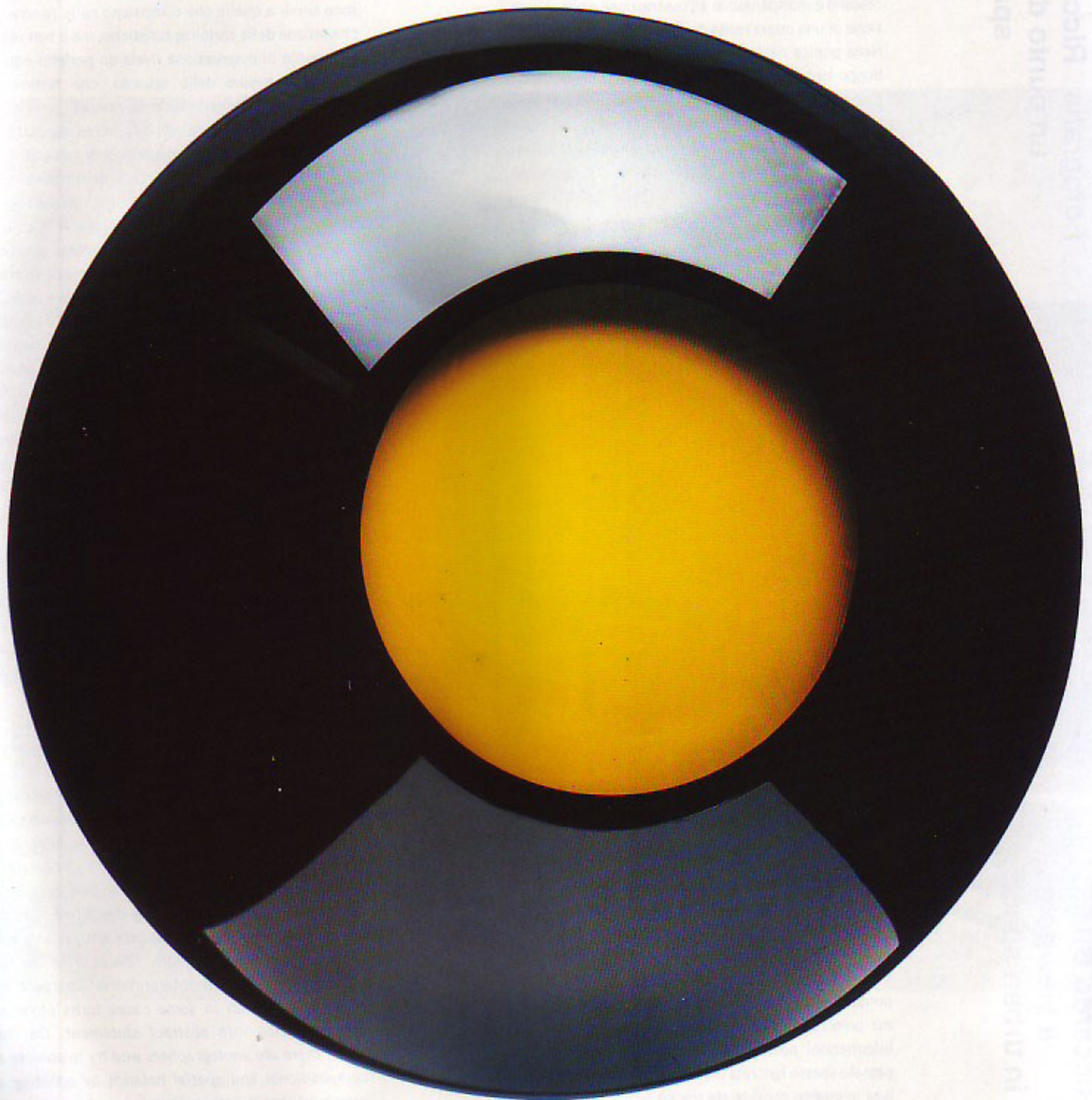
Abyss 5 (ø cm 26,5 - h cm 21,5)