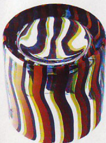
Abyss 1 (ø cm 22 - h cm 22)