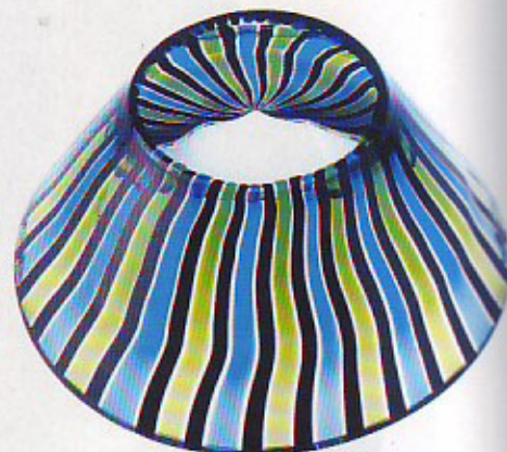
Abyss 7 (ø cm 30 - h cm 13,5)

"Abyss", collezione di 9 pezzi editati da Salviati ciascuno in 12 esemplari numerati e firmati. Tronchi di cono, sfere e cilindri di vetro soffiato, alternativamente in verde smeraldo trasparente, canne policrome e soprattutto nero lucido, con interventi di scalottamento della testa a scoprire i sottostanti strati di colore attraverso una "lente" vitrea. Dimensioni: altezza da cm 13,5 a cm 26; diametro da cm 22 a cm 38,5.